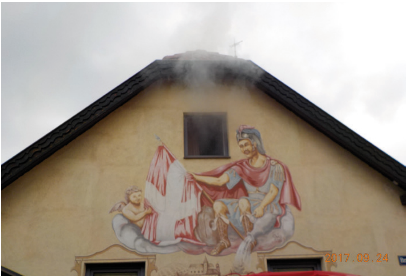
Am 24. 09. 2017 veranstaltete die Feuerwehr Gerasdorf eine interne Übung. Übungsannahme war ein Bürobrand mit einer vermissten Person im Feuerwehrhaus.