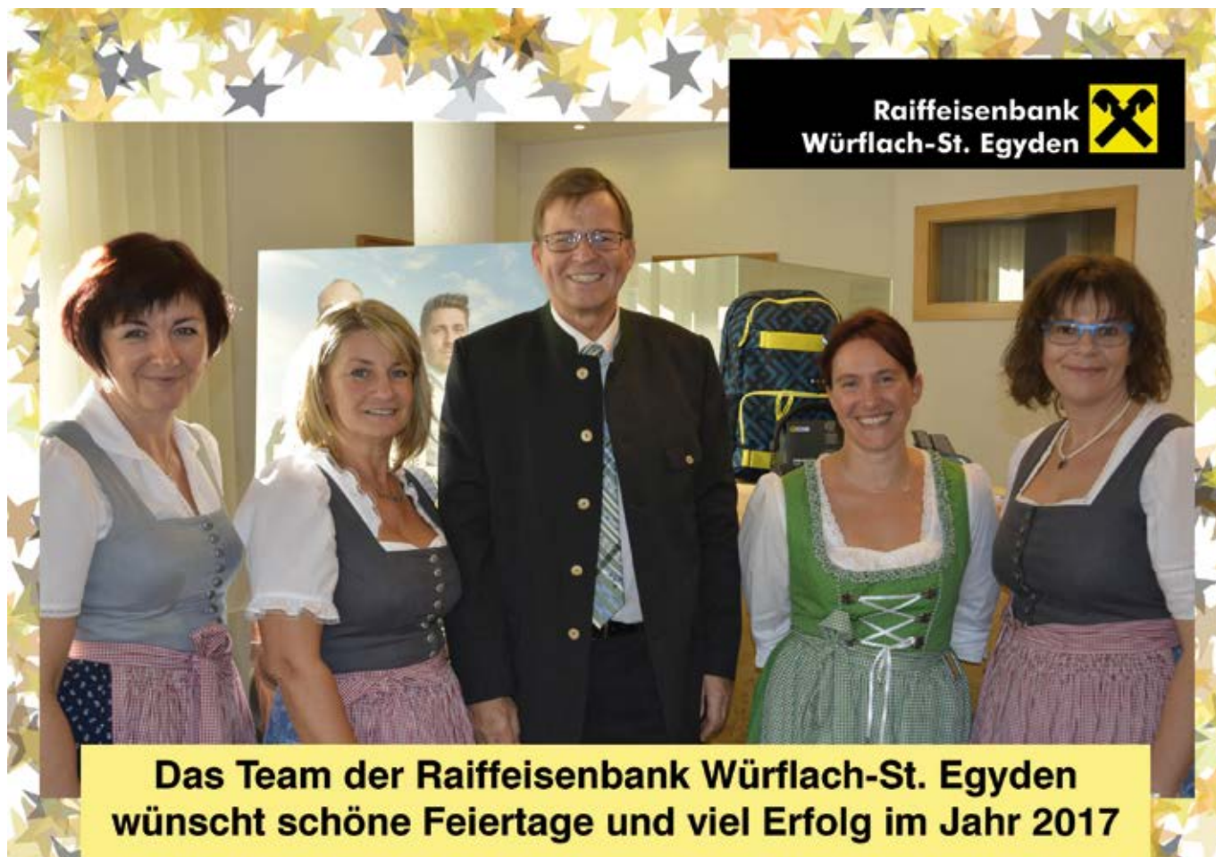
Das Team der Raiffeisenbank Würflach-St. Egyden wünscht schöne Feiertage und viel Erfolg im Jahr 2017