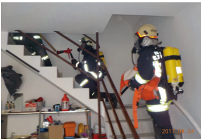
Nachdem sich der ATS-Trupp ausgerüstet hatte, drang er mit einer Löschleitung ins verrauchte Büro ein, löschte den Brand und begann mit der Personensuche.