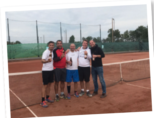
Ü 35 Tennismeister