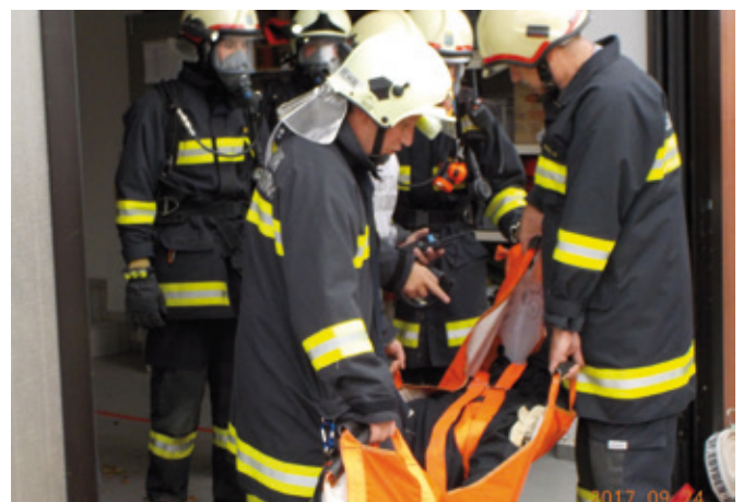
Nachdem Auffinden der Person wurde diese dem Rettungsdienst übergeben.