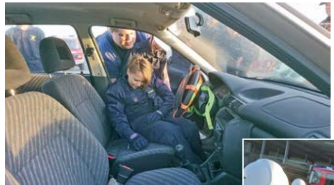
Personenrettung aus einem Fahrzeug