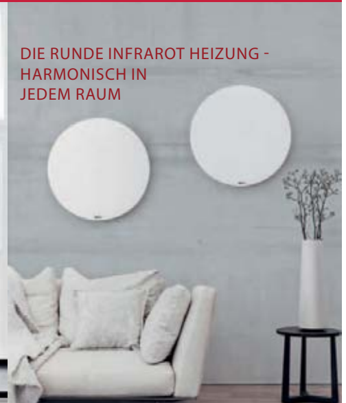
DIE RUNDE INFRAROT HEIZUNG - HARMONISCH IN JEDEM RAUM