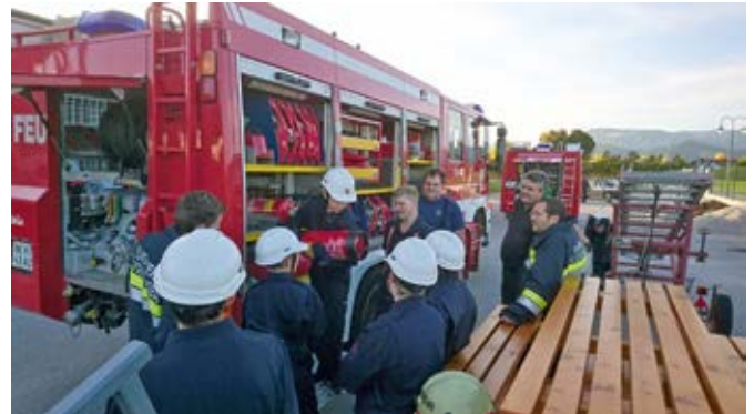
Brandschutz bei der Unfallstelle aufbauen

Wir danken allen Kameraden, die die Übung ausgearbeitet und betreut haben und natürlich dem Gasthaus Schwartz, welches das Essen für die Teilnehmer gespendet hat.