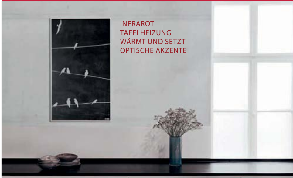
INFRAROT TAFELHEIZUNG WÄRMT UND SETZT OPTISCHE AKZENTE