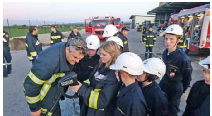
Handhabung einer Wärmebildkamara