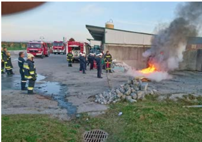
Feuerbekämpfung mit unterschiedlichen Löschmitteln