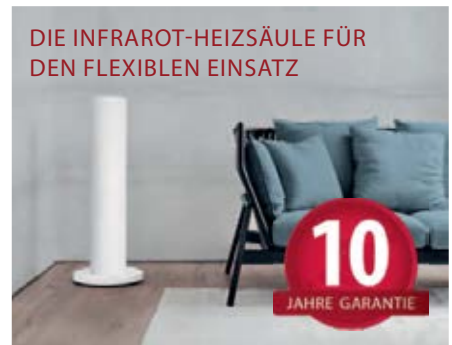
DIE INFRAROT-HEIZSÄULE FÜR DEN FLEXIBLEN EINSATZ