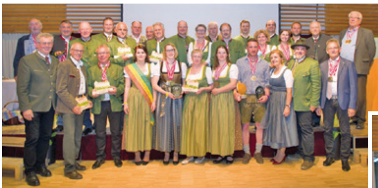
Alle Preisträger aus Niederösterreich

Alle Produkte konnten vor Ort verkostet werden. Ca. 300 Gäste feierten mit den Preisträgern.