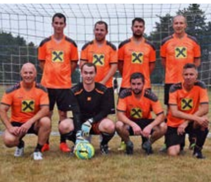
STR Team 1 und STR Team 2