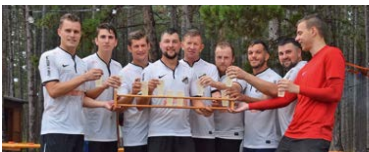
Turniersieger: die Unglaublichen