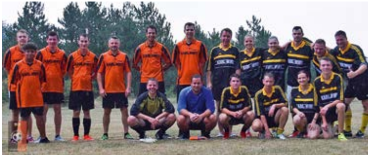
FF Neusiedl / FF Saubersdorf gegen FF Gerasdorf / FF Urschendorf