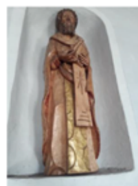
St. Egyden am Steinfeld

Hl. Egidius, geschnitzt Franz Pichler aus St. Egyden