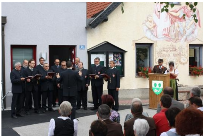
Für die musikalische Untermahlung unserer Eröffnung sorgte der Männergesangsverein von St Egyden.