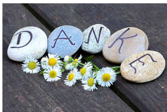
Künstlerisch gestaltet von Thomas Unger