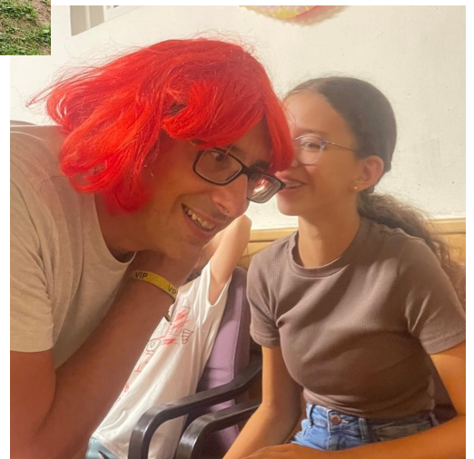
Lagerpapa als „Susi“ von Herzblatt

Alle Angaben ohne Garantie. Wünsche, Anregungen und Beschwerden können Sie an unsere EMail Adresse schicken, könnte aber ignoriert werden. Lob und Danksagungen lesen wir aber immer gerne, versprochen ;-). DANKE FÜR DIE TOLLE WOCHE!