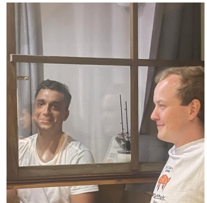
Die Gewinner des diesjährigen goldenen Besens