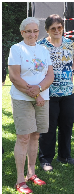
Christl die Lageromi